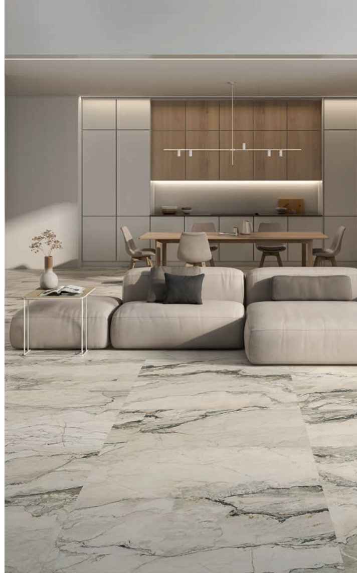
7. Serie Breccia

Las paletas de color neutras en estas colecciones resultan menos exuberantes que las piedras coloreadas pero, sin embargo, ofrecen una dimension arquitectónica que transmite sofisticación. Es el caso de las colecciones Brennero y Breccia Lunare, dos diseños que aprovechan al máximo el gran atractivo del mármol con formas dramáticas, formas escultóricas y reflejos de profundidad y sombra.