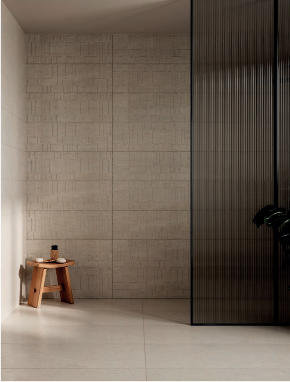
Khala Chance Cream