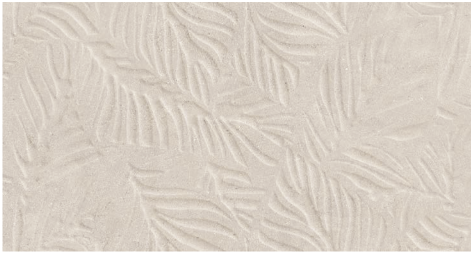
Lowell Savage Light