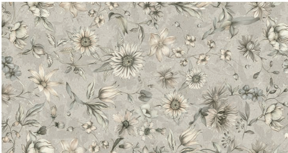
Kenzo Spring Ivory